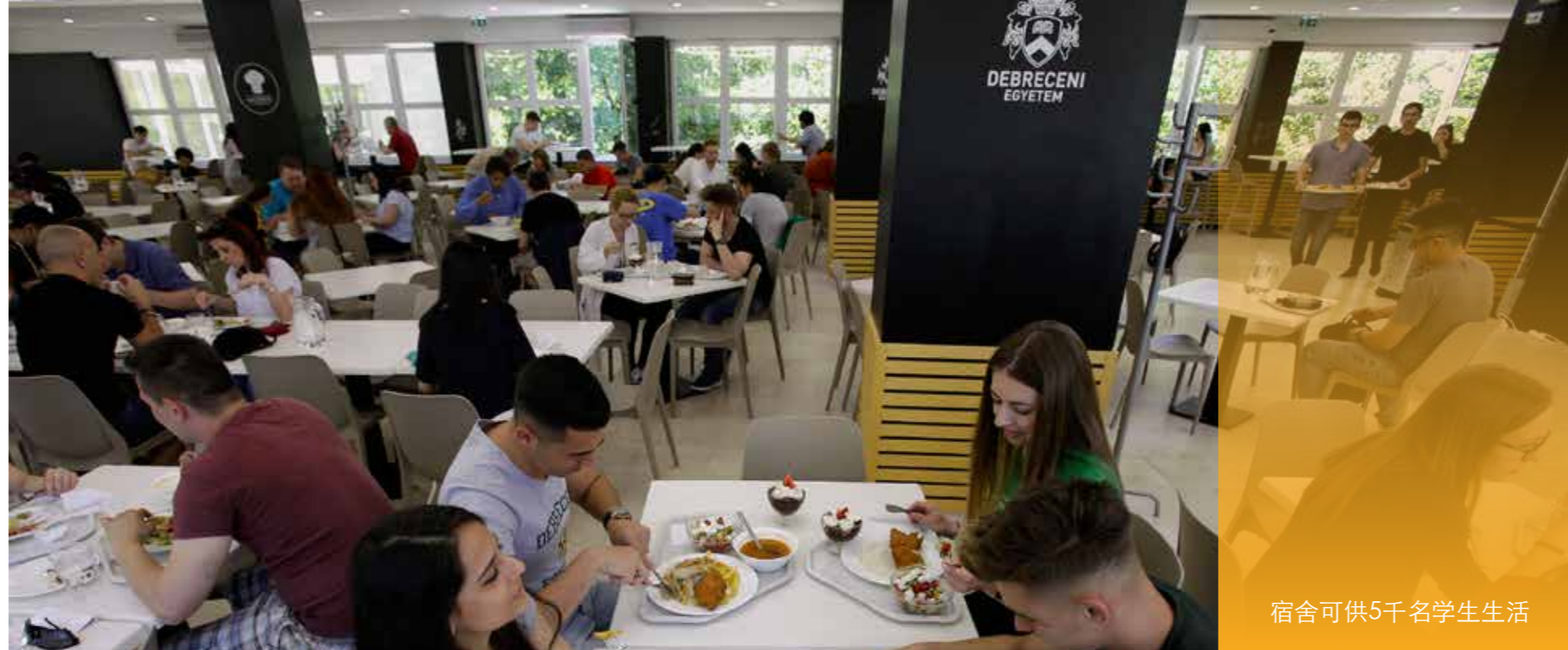
宿舍可供5千名学生生活

在德布勒森大学的14个宿舍单元可供近5000名学生生活。近五年，至少有86%的宿舍申请者都可以得到宿舍安置。这在匈牙利是一项杰出的成就，但是宿舍条件还会进一步改善，因为在接下来的七年内，到2023年为止的宿舍开发项目中，还要建成200间新宿舍房间。