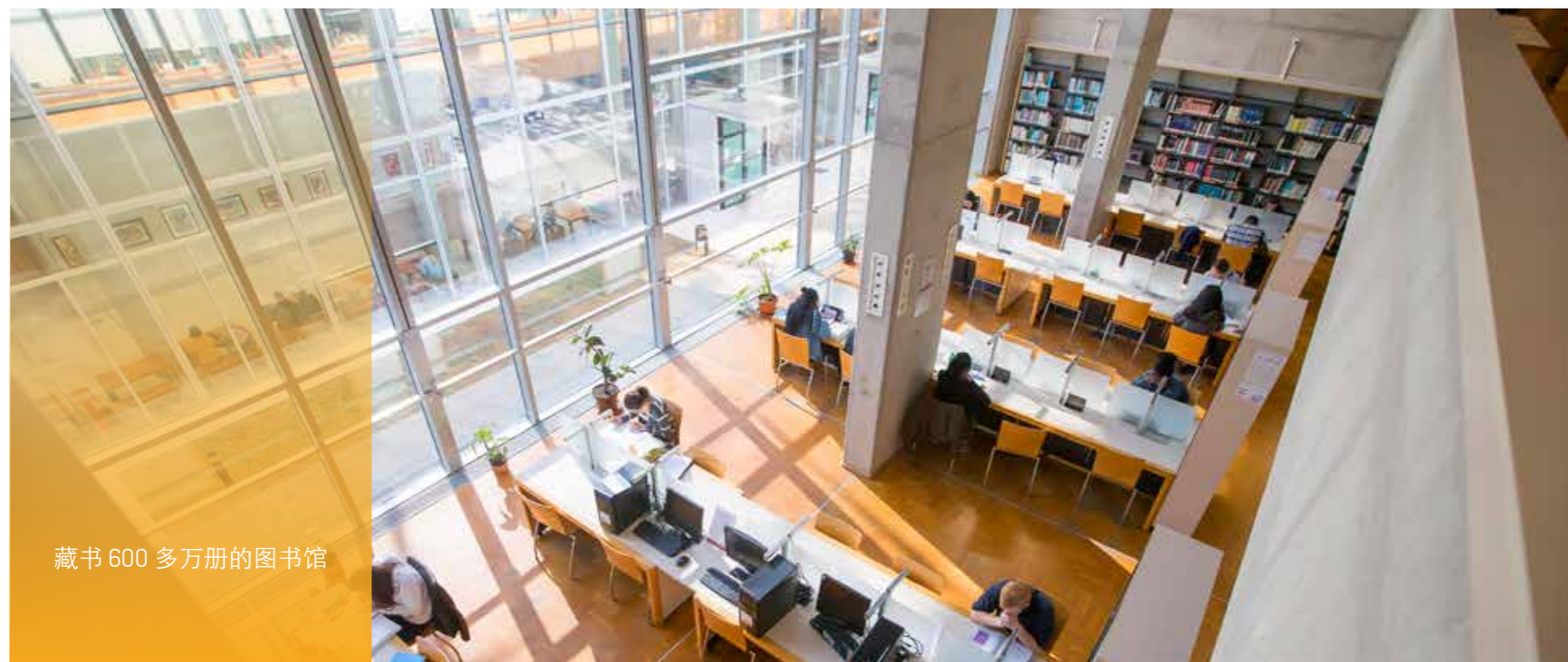
藏书 600 多万册的图书馆