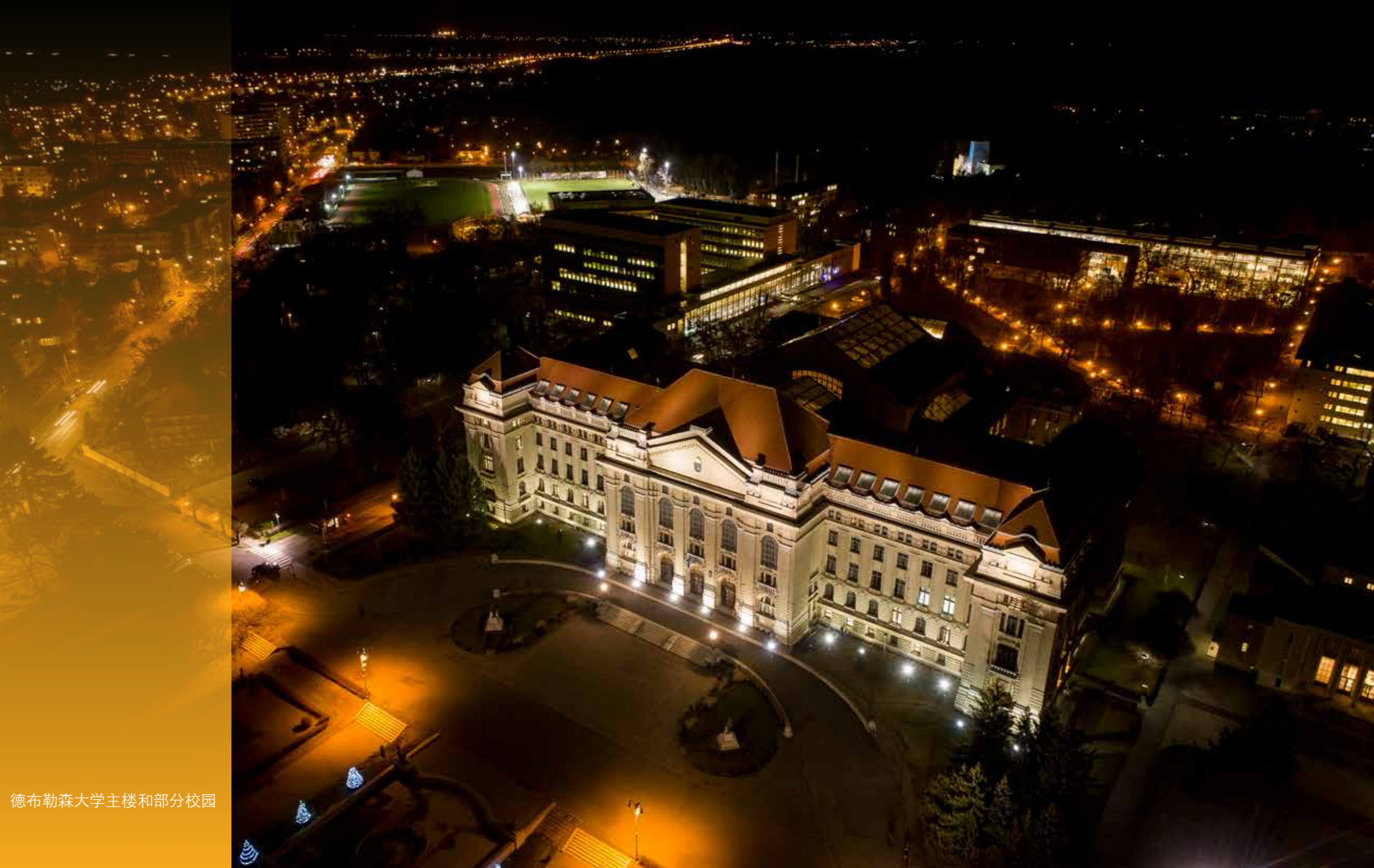
德布勒森大学主楼和部分校园