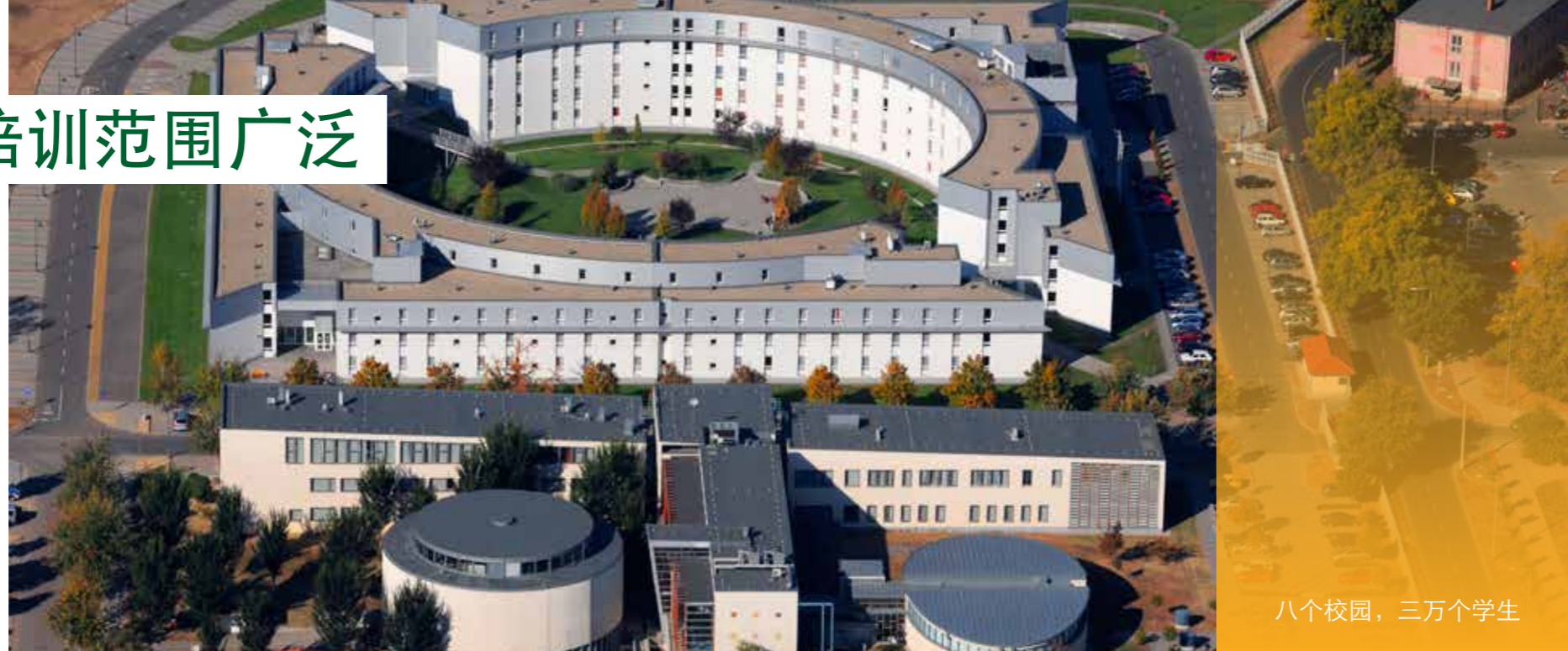
八个校园，三万个学生

就学生人数而言，德布勒森大学是匈牙利第二大学府，仅次于首都：在8个校园、14个学院和24个研究生院共有近3万个学生。外国留学生人数超过6000人，并且逐年增加。